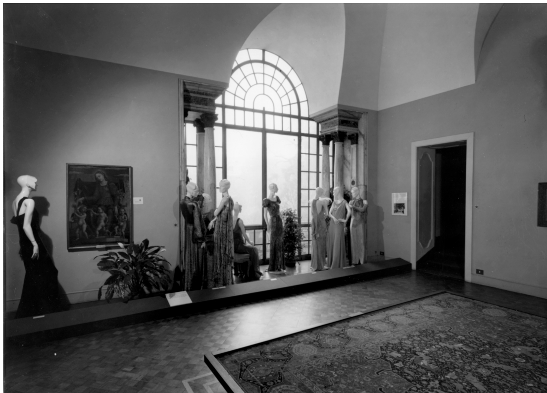
Figura 4: La mostra 1922–1943: Vent'anni di moda italiana , a cura di Grazietta Butazzi, Milano, Museo Poldi Pezzoli, 5 dicembre 1980–25 marzo 1981.

Fra le opere conservate ed esposte nel museo era disseminata una serie di gruppi di manichini in dialogo fra loro (nel Salone dorato l'installazione metteva in relazione manichini seduti e in piedi, di fronte alla grande finestra, secondo un modello che ricordava una conversation piece ) (Fig. 4).