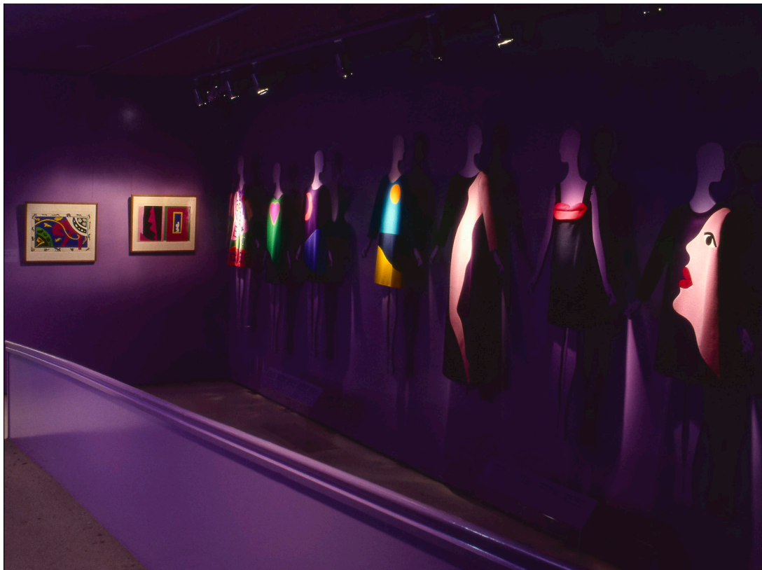
Figura 11: La mostra Yves Saint Laurent: Twenty-five years of design , a cura di Diana Vreeland, New York, The Metropolitan Museum of Art, The Costume Institute, 14 dicembre 1983–2 settembre 1984.