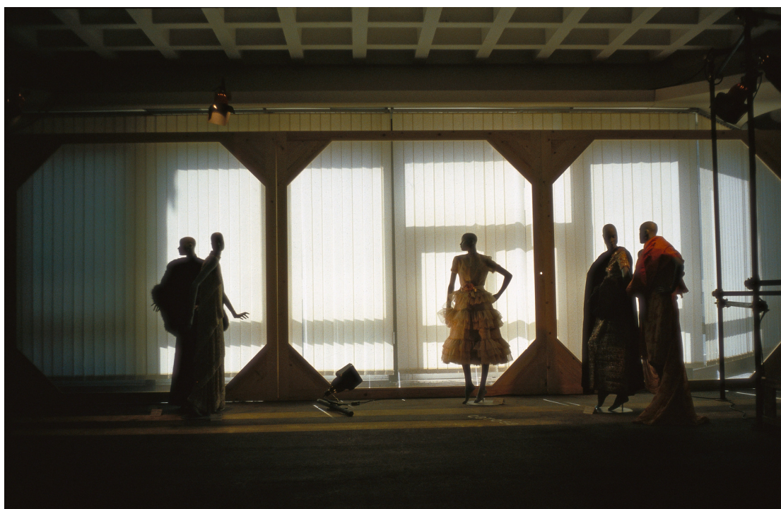
Figura 8: La mostra Il genio antipatico: Creatività e tecnologia della moda italiana 1951–1983 , a cura di Pia Soli, Roma, Salone dei congressi del parcheggio al Galoppatoio di Villa Borghese, aprile–maggio 1984.

trasformando in un marchio di fabbrica, anche per molte mostre di moda che sarebbero venute dopo di lei) al Costume Institute del Metropolitan Museum di New York.