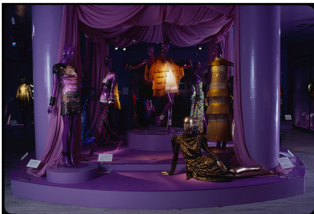
Figura 10: La mostra Yves Saint Laurent: Twenty-five years of design , a cura di Diana Vreeland, New York, The Metropolitan Museum of Art, The Costume Institute, 14 dicembre 1983–2 settembre 1984.

si configurava come uno statement sul grande contributo di Saint Laurent alla moda del ventesimo secolo, ovvero la sua capacità di lavorare sull'evoluzione delle proporzioni nella costruzione sartoriale che aveva definito e stava definendo la donna contemporanea. Non mancava quindi un'attenzione a elementi specifici del progetto di moda, anche se questo aspetto tendeva a perdersi nel percorso complessivo. In sostanza, Vreeland ha anche inaugurato soluzioni allestitivie inedite.