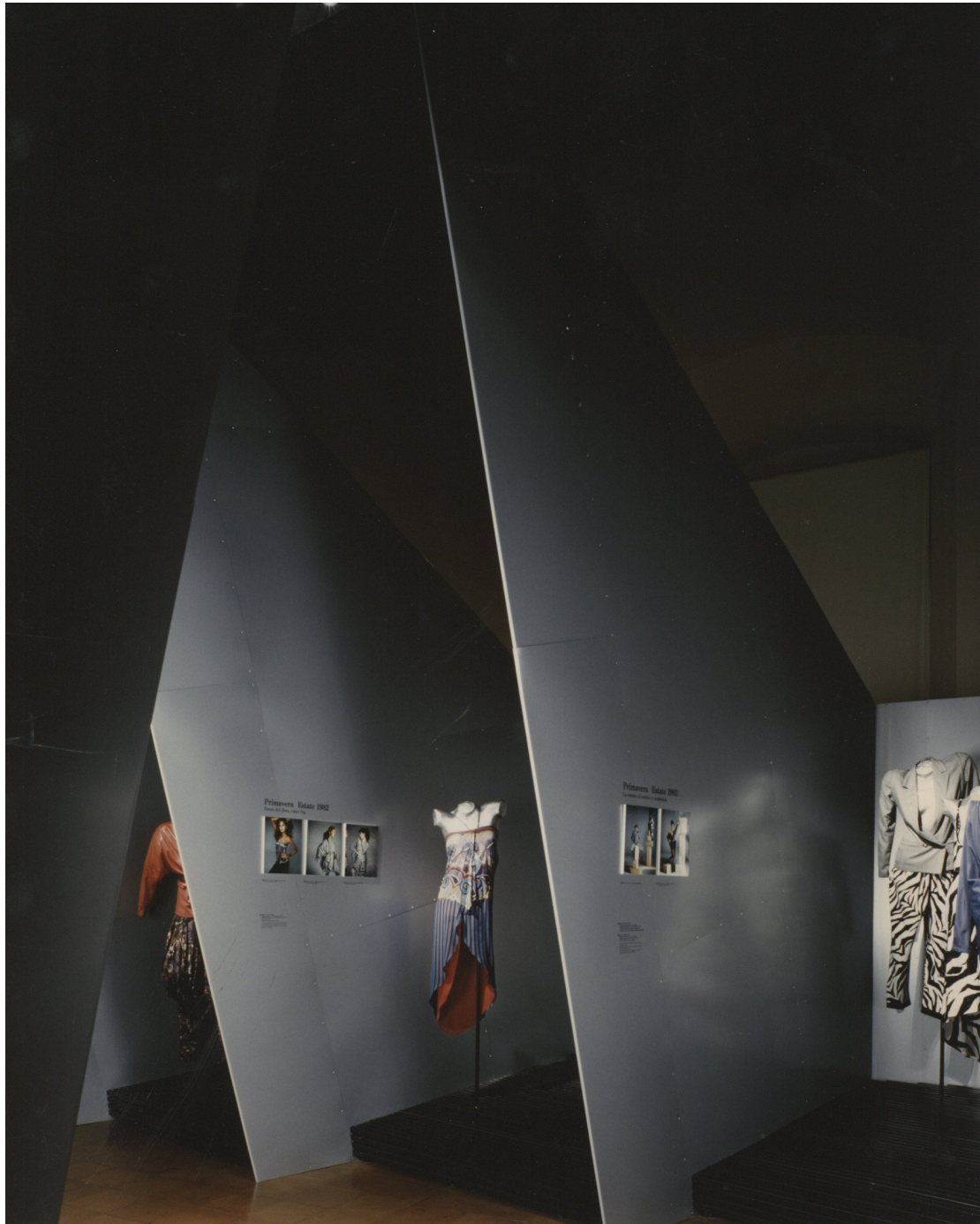
Figura 15: La mostra Gianni Versace: L'abito per pensare , a cura di Nicoletta Bocca con la collaborazione di Chiara Buss, Milano, Castello Sforzesco, 14 aprile-21 maggio 1989.