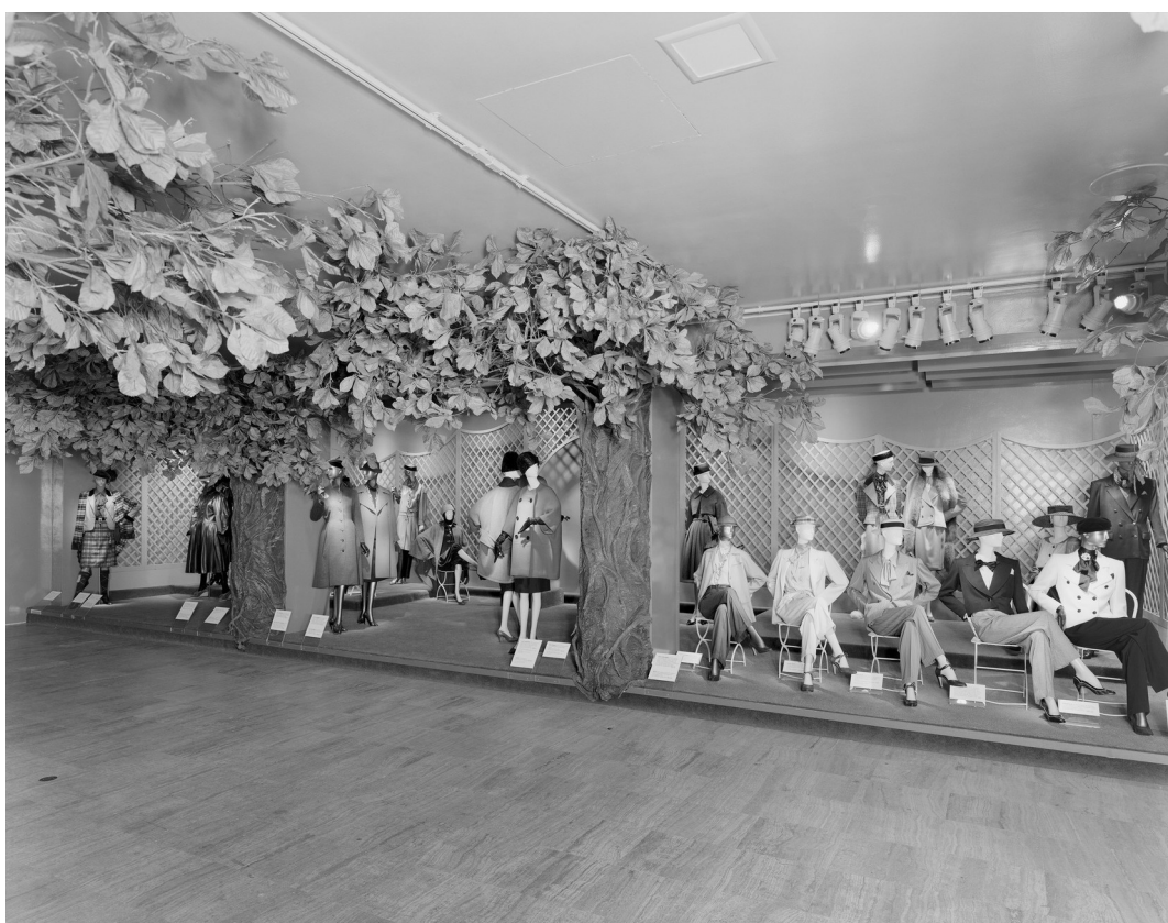
Figura 12: La mostra Yves Saint Laurent: Twenty-five years of design , a cura di Diana Vreeland, New York, The Metropolitan Museum of Art, The Costume Institute, 14 dicembre 1983–2 settembre 1984.

Vreeland, controversa, mediatica, dittatoriale, ha però riconosciuto alla moda contemporanea, in tutte le sue manifestazioni, un ruolo centrale come chiave d'accesso alla comprensione della cultura contemporanea, nella sua accezione più ampia e complessa allo stesso tempo. Richard Martin e Harold Koda 54 nel ricordare la sequenza di mostre curate da Vreeland al Costume Institute insistono nel sottolineare che pur nel progetto di spettacolarizzazione della moda in mostra, non mancavano tentativi di sottolineare la dimensione progettuale della moda, attraverso un'attenzione specifica alla definizione di quegli elementi che definiscono gli abiti e la loro storia sartoriale. 55 Nel lavoro di Vreeland al Costume Institute, il fashion curating iniziava, con alcuni gesti accennati sicuramente da sviluppare, a essere inteso come pratica che poteva coniugare elementi spettacolari, più immediatamente connessi con la cultura visuale e gli immaginari che appartengono alla moda, alla riflessione culturale (Fig. 12).