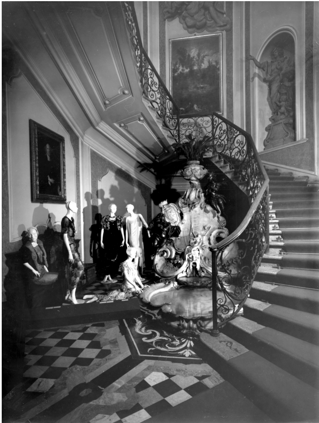
Figura 3: La mostra 1922–1943: Vent'anni di moda italiana , a cura di Grazietta Butazzi, Milano, Museo Poldi Pezzoli, 5 dicembre 1980–25 marzo 1981.