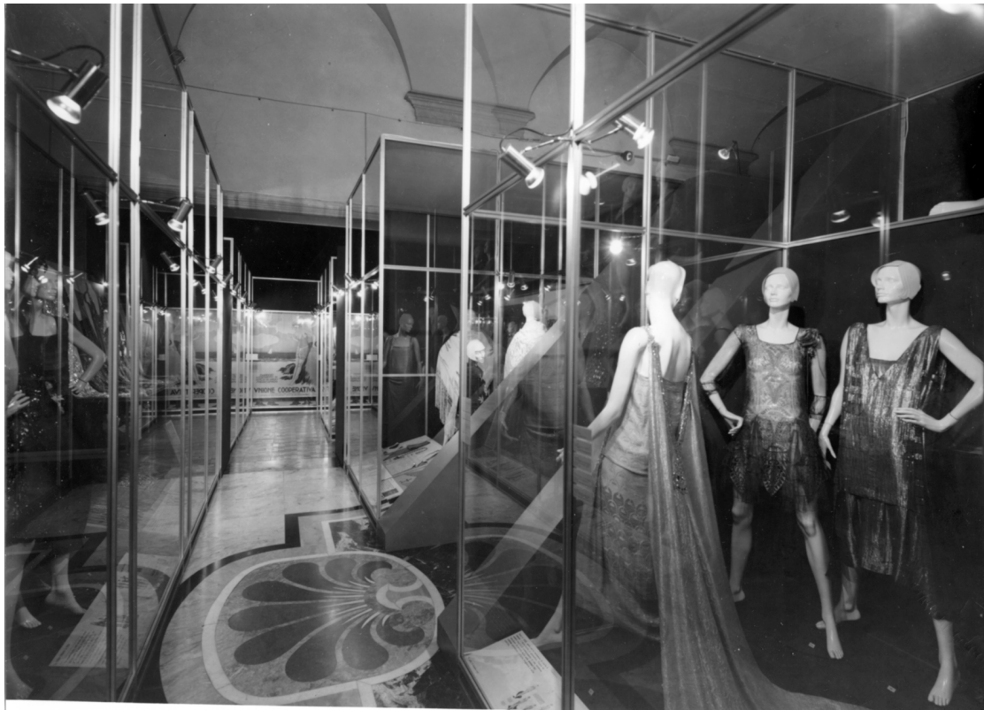
Figura 1: La mostra 1922–1943: Vent'anni di moda italiana , a cura di Grazietta Butazzi, Milano, Museo Poldi Pezzoli, 5 dicembre 1980–25 marzo 1981.