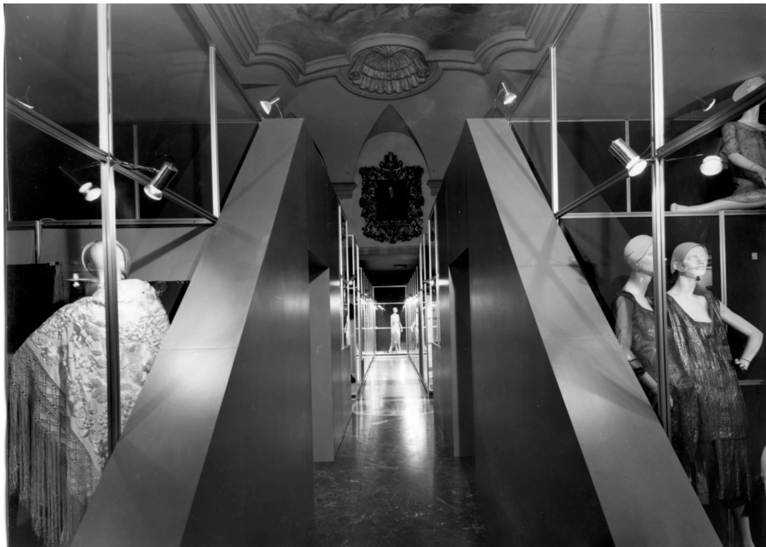
Figura 2: La mostra 1922–1943: Vent'anni di moda italiana , a cura di Grazietta Butazzi, Milano, Museo Poldi Pezzoli, 5 dicembre 1980–25 marzo 1981.