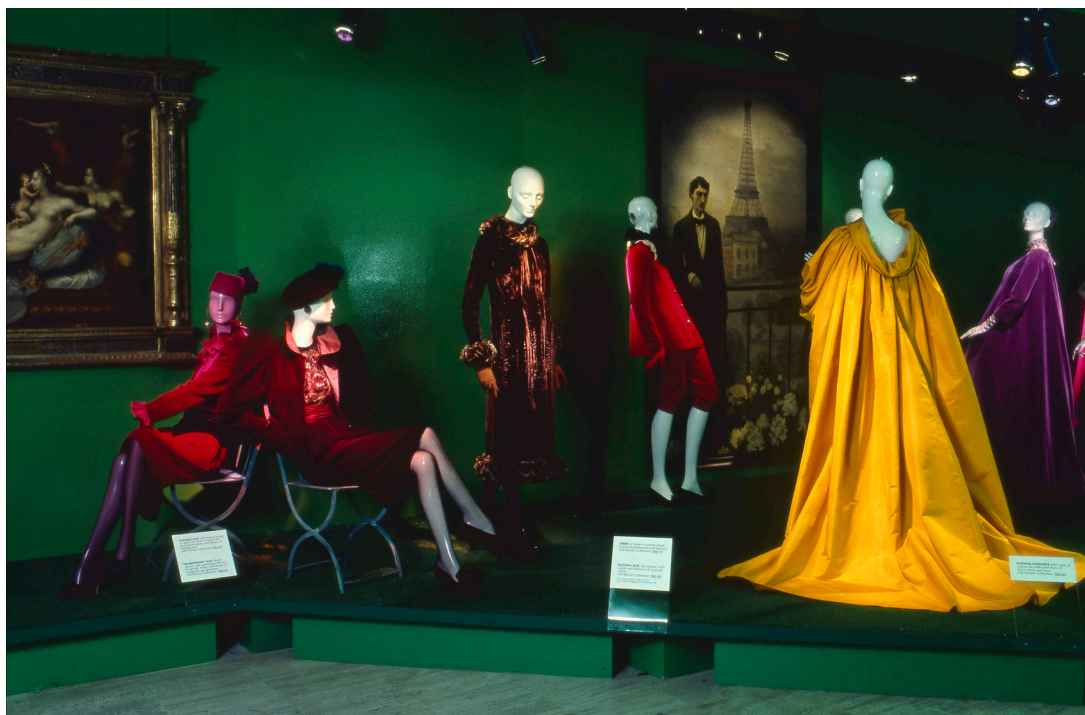
Figura 9: La mostra Yves Saint Laurent: Twenty-five years of design , a cura di Diana Vreeland, New York, The Metropolitan Museum of Art, The Costume Institute, 14 dicembre 1983–2 settembre 1984.

L'immaginazione editoriale della Vreeland, quindi, dominava la mostra, che si configurava principalmente come una sequenza di conversation piece fra manichini, non avvicinati per ragioni cronologiche, ma principalmente sulla base di suggestioni cromatiche e di temi (Fig. 9), come l'evocazione di un altrove esotico creato attraverso riferimenti a un'idea del Marocco o della Russia.