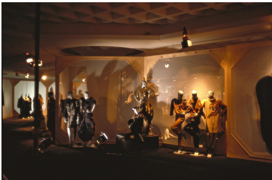
Figura 7: La mostra Il genio antipatico: Creatività e tecnologia della moda italiana 1951–1983 , a cura di Pia Soli, Roma, Salone dei congressi del parcheggio al Galoppatoio di Villa Borghese, aprile–maggio 1984.

Anche se è molto difficile recuperare immagini dell'allestimento di questa mostra, due piccole fotografie sono pubblicate sul numero di Domus del luglio–agosto 1984 e accompagnano un breve testo di presentazione redatto da Maria Pia Bobbioni a proposito della tappa romana (Figg. 7 e 8).