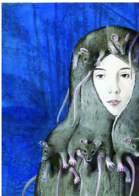
Figura 5 – Un mantello di pelle di topo. Illustrazione tratta da Jacob e Wilhelm Grimm and Fabian Negrin. Principessa Pel di Topo e altre 41 fiabe da scoprire . Roma: © Donzelli, 2012. Tutti i diritti riservati.

secoli, ha portato la letteratura a coniare l'espressione "romanzi di cappa e spada". 18 Oggi, i mantelli, i drappi e le cappe sono un capo elegante, indossato dal pubblico femminile, quasi esclusivamente sopra l'abito da sera. Presentano ricchi ornamenti (ricami e impuntature di broccato) e preziose bordature di pelliccia, raso o velluto. È interessante rilevare come, invece, nella fiaba le cappe ed i mantelli, che garantivano la miglior "copertura identitaria" all'eroina, hanno un'origine totalmente diversa. Essi erano per lo più realizzati con pelli e pellicce d'animali. Animali non comuni, si badi bene, ma animali che destavano senso di disgusto e di ribrezzo. Un rimando va ovviamente fatto alla fiaba di Pelle d'Asino , di Charles Perrault, in cui una principessa, per sfuggire al matrimonio con il proprio padre, si rende irriconoscibile, indossando una pelle d'asino. Stessa sorte capiterà anche a Dognipelo e alla Principessa Pel di Topo , dei Fratelli Grimm, in cui le due protagoniste, per sfuggire alle mire moleste del rispettivo padre, si avvolgono nel primo caso in un mantello fatto con pellicce d'animale d'ogni sorta, mentre, nel secondo caso, in un vestito di pelle di topo (Fig. 5).