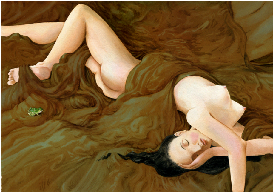
Figura 1 – Il corpo femminile incarna la bellezza. Illustrazione tratta da Jacob e Wilhelm Grimm e Fabian Negrin. Principessa Pel di Topo e altre 41 fiabe da scoprire . © Roma: Donzelli, 2012. Tutti i diritti riservati.