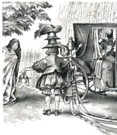
Figura 2 – Svestizione e vestizione del giovane figlio del mugnaio. Illustrazione tratta da Charles Perrault and Adriano Gon. Il Gatto con gli stivali . Pordenone: Edizioni C'era una volta..., 1995.