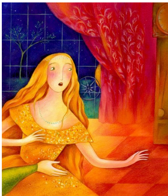
Figura 7 – Una coroncina di perle sui lunghi e bellissimi capelli biondi. Illustrazione tratta da Charles Perrault, Paola Parazzoli e Antonella Abbatiello. Cenerentola . Milano: Fabbri, 2011.

Nella fiaba, la capigliatura assume una particolare rilevanza, anche quando essa, ad esempio, risulta essere visibile o nascosta, annodata o sciolta: è il segno della disponibilità, dell'offerta o del ritegno della donna. Pure il gesto di pettinarli si sostanzia per una sua implicazione simbolica. Pettinare i capelli di qualcuno