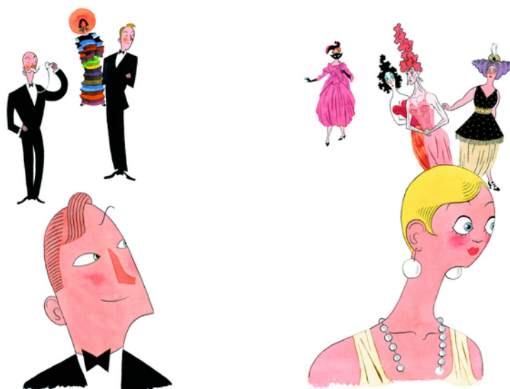
Figura 8 – Il carattere nobile della perla illumina la persona che la indossa. Illustrazione tratta da Steven Guarnaccia. Cenerentola . Mantova: Corraini, 2013. © Steven Guarnaccia, Cenerentola . Courtesy Corraini Edizioni.

è segno di cura, attenzione e buona accoglienza, come quando Cenerentola (nella versione di Charles Perrault) aiuta le sorellastre a prepararsi per il ballo e si offre di pettinare loro i capelli (Fig. 9).