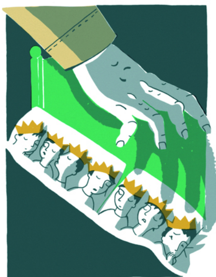
Figura 4 – Piccole coroncine salvifiche. Illustrazione tratta da Charles Perrault e Gemma O'Callaghan. Fiabe . Roma: La Nuova Frontiera Junior, 2018.