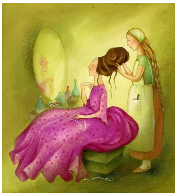
Figura 9 – Pettinare i capelli: quali implicazioni simboliche?. Illustrazione tratta da Charles Perrault, Paola Parazzoli and Antonella Abbatiello. Cenerentola . Milano: Fabbri, 2011.

Molto può essere ancora studiato ed indagato, soprattutto, a livello comparativo, sistematizzando, con maggiore rigore metodologico, la selezione delle fiabe e gli oggetti da analizzare.