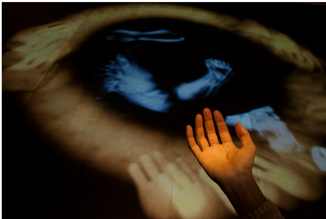
Figure 9-10: Studio Azzurro, In principio (e poi) , ambiente sensibile, Padiglione della Santa Sede, Arsenale, 55 a Esposizione Internazionale d'Arte Biennale Venezia, 2013