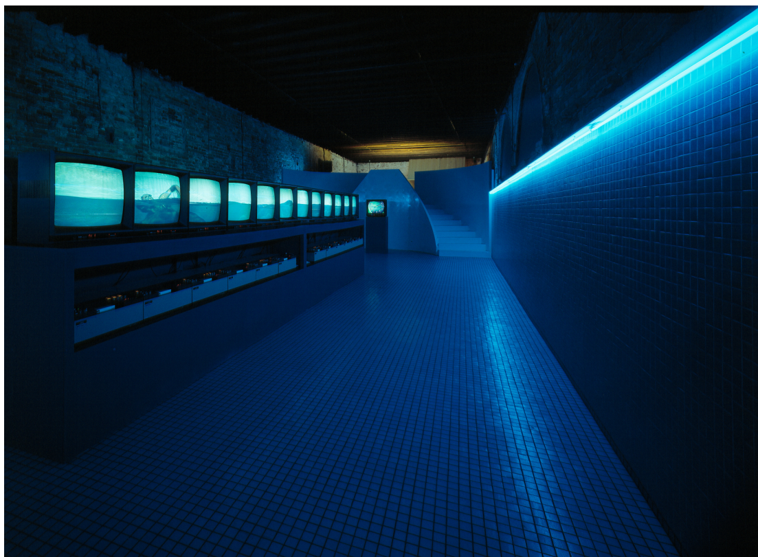
Figura 6: Studio Azzurro, Il nuotatore (va troppo spesso ad Heidelberg) , videoambiente, Palazzo Fortuny, Venezia, 1984

C'è poi un altro aspetto legato all'imprevisto, che è una forma di 'imperfezione' che dà anima a un lavoro. Lo racconta bene un aneddoto legato alla realizzazione del videoambiente Il nuotatore (va troppo spesso ad Heidelberg) (Venezia, 1984). La prima sessione di un'ora di riprese (con 12 telecamere immerse in una piscina!) fu realizzata con un nuotatore professionista. Il risultato era talmente perfetto da lasciare... insoddisfatti. Così si provò a registrare una seconda sessione con un amico appassionato di nuoto, ma non professionista. Via via che nuotava si manifestava nei gesti e nella postura del corpo il suo progressivo affaticamento, che provocava un'empatia e una percezione del tempo irraggiungibili con le riprese del professionista. Inutile aggiungere che furono scelte le riprese con la nuotata 'imperfetta'!