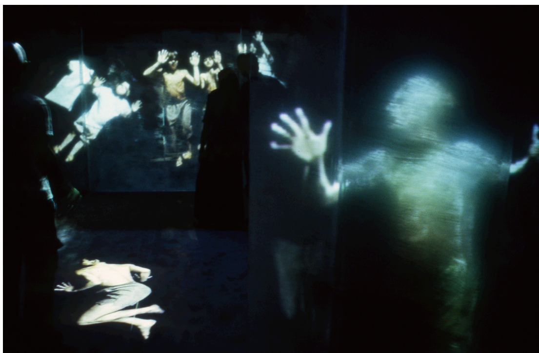
Figura 5: Studio Azzurro, Dove va tutta 'sta gente , ambiente sensibile, 'Vision Ruhr', Dortmund, 2000

Per rispondere però preferisco riferirmi al corpo inteso come presenza in uno spazio sociale e culturale con l'opera Dove va tutta 'sta gente (Dortmund, 2000), un ambiente sensibile in cui una moltitudine di corpi, nel tentativo di superare un confine invisibile, si schianta ripetutamente sugli schermi davanti a noi. Un progetto legato a un momento storico in cui i corpi veri si erano riaffacciati nell'immaginario collettivo, riprendendosi uno spazio inatteso e scioccante all'interno dell'informazione mediatica. Erano gli anni dei primi sbarchi dall'Albania e quest'opera rispondeva a un evento che riguardava il ripresentarsi del corpo vero e sofferente all'interno di uno scenario che tentava di allontanarlo dagli sguardi, provocando indifferenza e rifiuto.