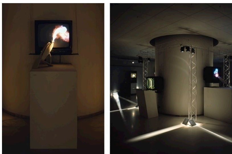
Figure 7a-7b: Studio Azzurro, Luci di inganni , videoambiente, Showroom ARC-74, Milano, 1982

Un altro elemento chiave del dispositivo di narrazione di tutti i videoambienti, realizzati fra gli anni Ottanta e Novanta, è la frammentazione del racconto e la sua cucitura attraverso la sincronizzazione dei monitor. Nata con il supporto dei monitor, nel tempo è diventata una caratteristica estetica forte della nostra narrazione. Il caso forse più emblematico è Il nuotatore (va troppo spesso ad Heidelberg) , dove si può vedere un corpo umano in scala 1:1 'nuotare' attraversando 12 monitor in un flusso continuo eppure spezzato, proprio come se l'immagine attraversasse i fotogrammi di una pellicola cinematografica! Questo accorgimento stimola nella visione umana la ricostruzione soggettiva del movimento: all'osservatore manca una serie di piccoli frammenti della sequenza e il sofisticato dialogo occhio-cervello li integra spontaneamente, completando da sé la narrazione.