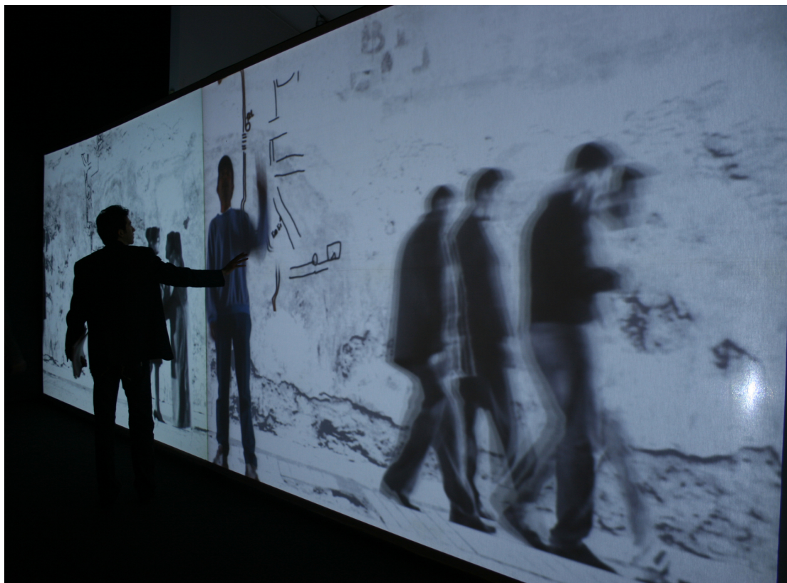
Figura 1: Studio Azzurro, Sensible map , portatori di storie, ambiente sensibile, Casablanca, 2008