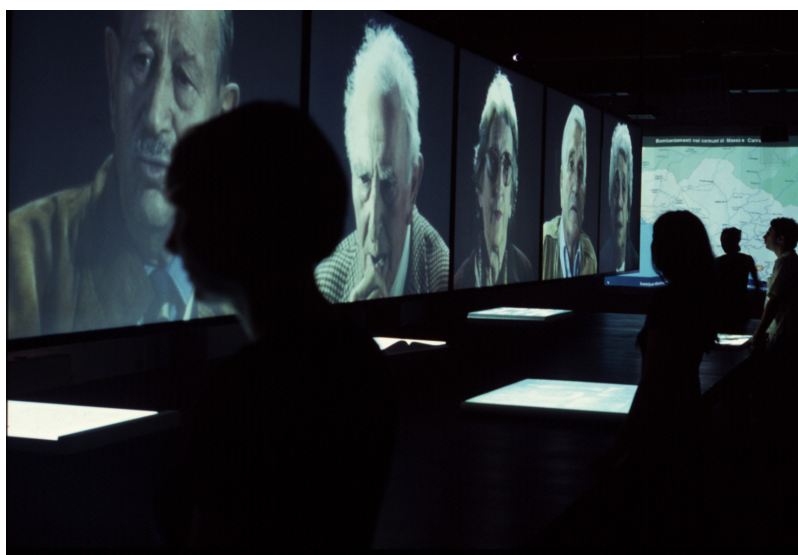
Figura 4: Studio Azzurro, Museo Audiovisivo della Resistenza , Fossdinovo, 2000