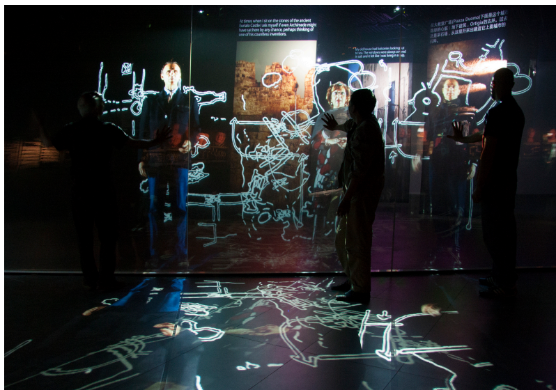
Figura 3: Studio Azzurro, Sensitive city , portatori di storie, ambiente sensibile, Padiglione Italia, EXPO, Shanghai, 2010

un'opera che valorizzasse le vite e le esperienze dei lavoratori, e con esse il mondo contraddittorio che si crea intorno a questa attività. L'opera si inserisce nella serie dei 'portatori di storie' ed è rimasta esposta per alcuni mesi nel suo territorio, come è accaduto anche con The Forth Ladder (Santa Fè, 2008), nel Nuovo Messico.