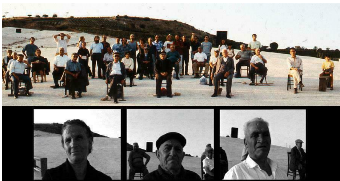
Figura 2: Studio Azzurro, Ultima forma di libertà, il silenzio , spettacolo, XII Edizione Orestiadi, Gibellina Vecchia, 1993